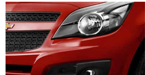
Faros con encendido y apagado automático