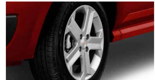
Rines de aluminio de 16"