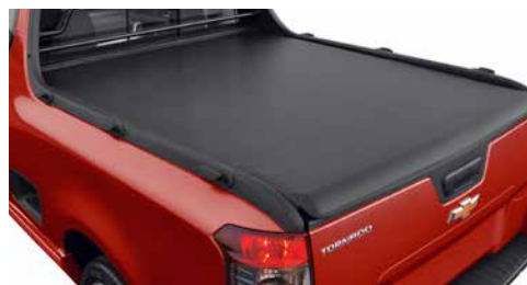
Cubierta suave para caja

Pregunta a tu Distribuidor por los accesorios disponibles y personaliza tu Chevrolet Tornado® 2018 de acuerdo a tus necesidades.