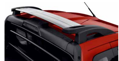
Spoiler de techo