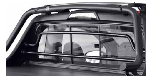
Rejilla de protección para medallón trasero